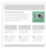
Annonces illustrées sur des sites Web