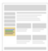
Annonces textuelles sur des sites Web