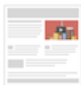
Annonces vidéo sur des sites Web