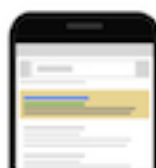
Annonces sur des sites Web pour mobile

6 - Vous arrivez maintenant dans la section “Paramètres généraux” cochez les cases correspondant aux différentes méthodes pour atteindre votre objectif